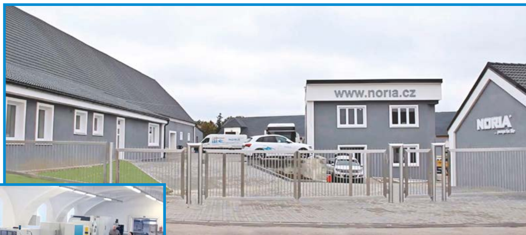
Výrobní areál společnosti NORIA v Tavíkovicích