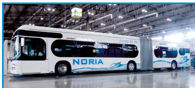
NORIA BUS pro veletrhy a výstavy