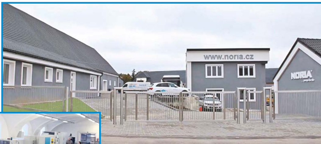
Výrobní areál společnosti NORIA v Tavíkovicích