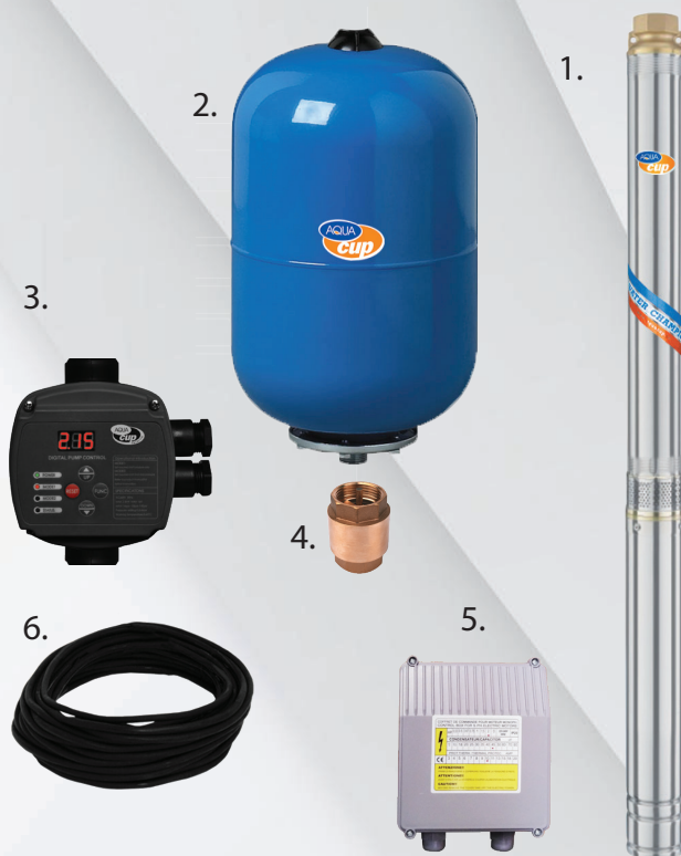
1. Čerpadlo 3" ELECTRA